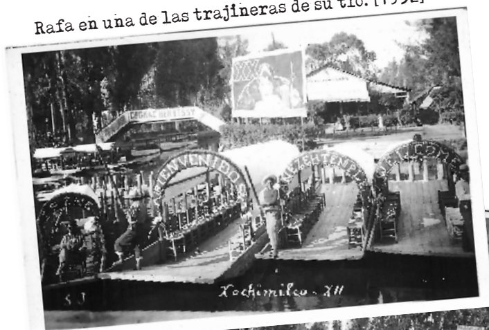
Rafa en una de las trajineras de su tío. [1952]

1954. Oaxaca. Un joven nacido bajo una luna de sangre es torturado cada vez más por vívidas pesadillas a medida que envejece. En su cumpleaños número 21, su madre llama a un sacerdote para que decida su destino. En el viaje fuera del pueblo, el sacerdote desaparece. Abandonado sin dinero y lejos de casa, su única pista es una foto de su padre separado que huyó a Xochimilco poco después de su nacimiento. En el camino se encuentra con otro chico de su edad y los dos parten en busca de su padre, sin saber que su padre ha jurado matarlo si sus caminos alguna vez se cruzan. En los soñolientos canales de Xochimilco no todo es lo que parece cuando un peligro y un apoyo inesperado chocan, revelando su verdadera naturaleza. Pero su viaje hacia la interior amenaza con destruirlo a él y a quienes lo rodean cuando se reencuentra con su padre, y obliga a las viejas supersticiones a sangrar en la vida real.