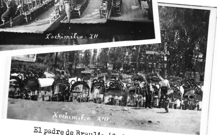
El padre de Braulio. [fecha desconocida]