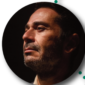
TÍO de RAFA