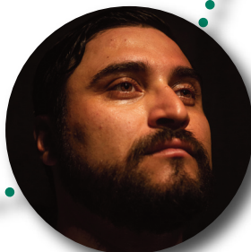
PADRE de BRAULIO